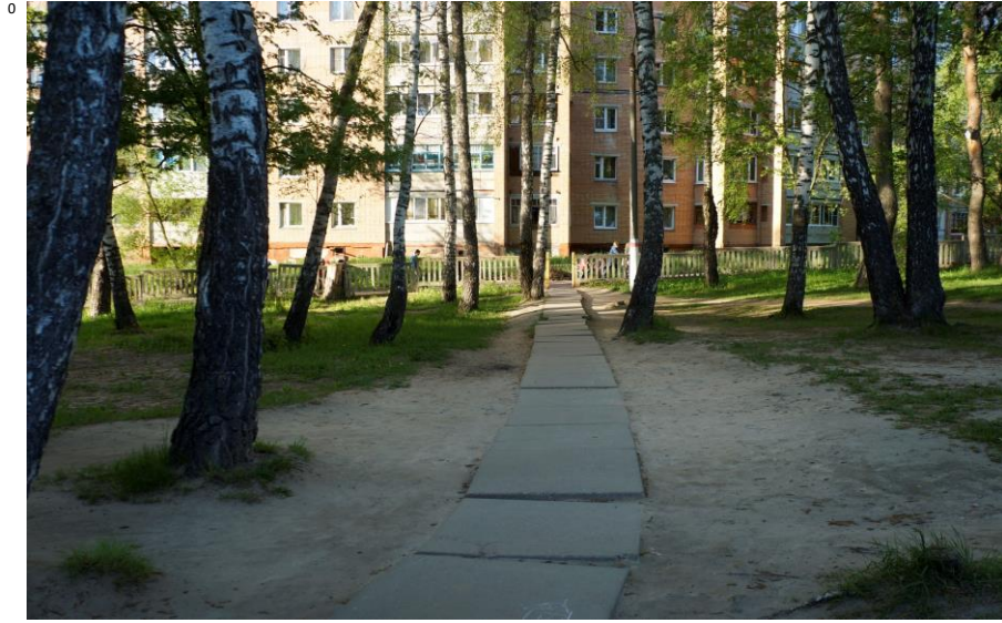
подход к лицее со стороны района