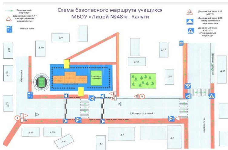
Пути передвижения транспортных средств к местам разгрузки/погрузки и рекомендуемые пути передвижения детей по территории МБОУ «Лицей №48» г. Калуги